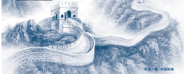
华龙一号 中国骄傲

邢继 中核集团首席专家、“华龙一号”总设计师，中国核电工程有限公司总工程师。先后担任岭澳二期、国产化二代改进型核电机组（CP1000）总设计师，全面参与、主持了国内核电技术引进、消化吸收、自主创新的全过程，具有丰富的核电设计、工程建设经验和卓越的技术水平，是我国能源领域的核电工程设计专家，2006年起享受国务院政府特殊津贴。